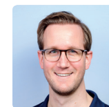
Björn Bogs Klinik für Kardiologie und Angiologie Elisabeth-Krankenhaus Essen

*Ausstellungsstand, Nennung im Programm und PowerPoint